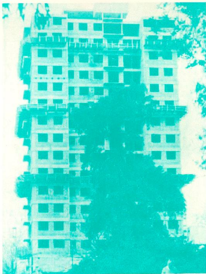
FALUCHO IX - REMEDIOS DE ESCALADA DE SAN MARTIN 2138 CAPITAL FEDERAL OBRA COMPRENDIDA EN EL PLAN DE MIL VIVIENDAS