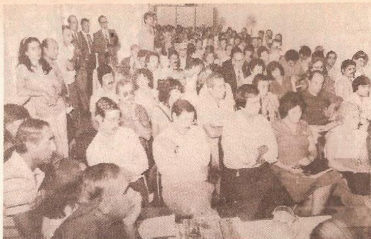
Asambleistas del Distrito Capital Federal - Gran Buenos Aires.